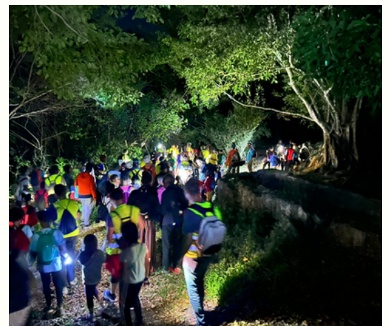
Arrivée à proximité de l'habitation Poyen et petit point d'histoire.

La peur car on a vu des os de bœufs et j'ai eu peur de tomber dans l'eau.