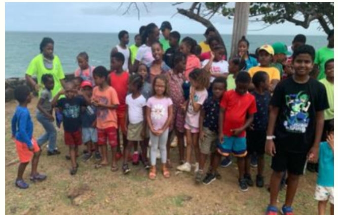
Enfants et Ados en randonnée sur le littoral du nord Basse - Terre

Dans le cadre du programme national de lutte contre les noyades, le Savoir Nager en Sécurité devient une compétence à acquérir en priorité entre 7 et 12 ans. Elle est précédée par l'acquisition de l'aisance aquatique qui concerne les enfants de la maternelle. Les enfants retenus pour cette session sont du secteur de Boucan Sainte Rose 97115. GETT UP STAND UP a accueilli 34 enfants par groupe de niveau pour un stage massé de 6 jours dont une journée en mer (plage de Mambia sainte Rose 97115). Outre l'apprentissage de la natation, ces enfants ont eu une initiation au waterpolo et à la natation artistique. La journée à la plage a débuté par une randonnée pédestre le long du littoral du Nord Basse - Terre, puis la session de secourisme et de sauvetage aquatique a occupé le reste de la journée. L'évaluation finale s'est déroulée le vendredi 23 février ; ce même jour, les parents ont pu échanger avec les professionnels du bus de la parentalité (ti kozé an fanmi).