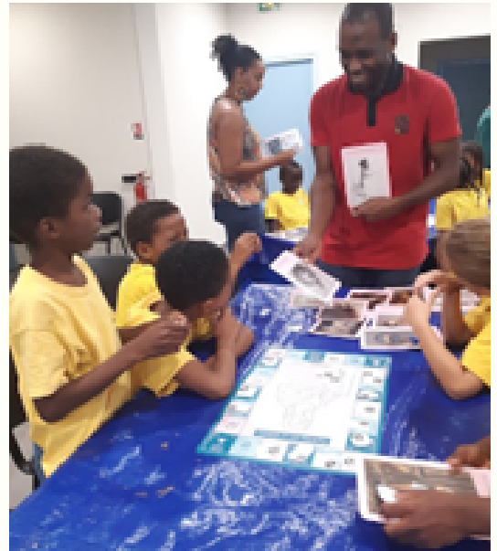
Ecole élémentaire MIXTE 1 SR au MUS'ARTH à POINTE à PITRE Jeu de société pour renforcer les connaissances en histoire des arts, à partir du tableau « La Joconde » de Léonard de VINCI.

Après avoir découvert le mode de vie des amérindiens, les élèves sont initiés à la poterie.