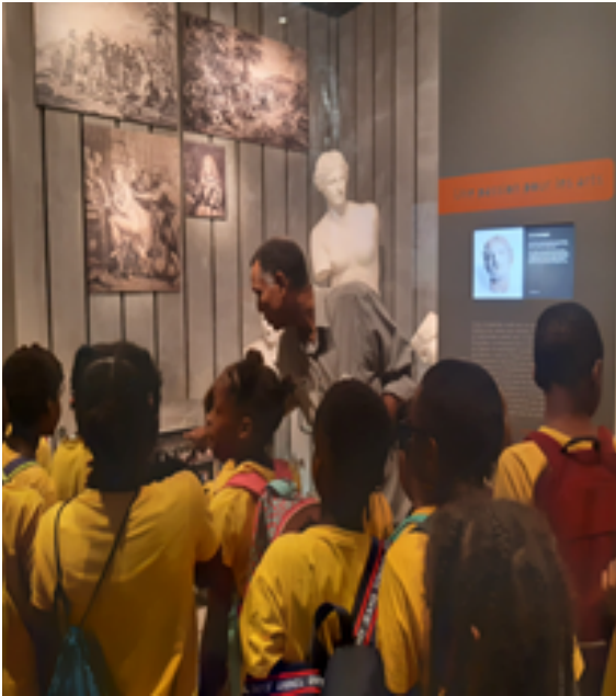
Ecole élémentaire MIXTE 1 SR au mus'arth à POINTE à PITRE. Les élèves découvrent les sculptures et photographies anciennes.

Afin de permettre aux élèves d'acquérir une culture artistique, des visites aux musées et/ou galerie d'art leur ont été proposées, ceci afin de rencontrer de réelles œuvres d'artistes que les élèves sont habituellement amenés à voir uniquement sous format papier (photocopie) ou projetées sur écran. Au mus'arth, les élèves de l'école élémentaire BOURG 1 SR, ont pu apprécier des sculptures et photos anciennes. Ils ont également participé à un jeu de société pour renforcer les connaissances en histoire des arts, à partir du tableau « La Joconde » de Léonard DE VINCI.