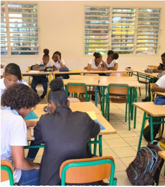
SÉANCE DE TRAVAIL EN CLASSE

Né de la collaboration de deux ingénieurs de l'École Centrale Paris passionnés des technologies et de l'éducation, KWYK, Know What You Know, est une plateforme en ligne qui propose des exercices en mathématiques et physique-chimie. Elle a pour but d'entraîner les élèves sur toute la partie technique pour leur faire acquérir des automatismes, travailler de façon autonome et les faire progresser à leur rythme de façon personnalisée. Chaque mois, le professeur de la classe reçoit un bilan des performances qui tient compte de critères tels que : la persévérance, l'autonomie, la régularité, l'engagement dans les exercices. Ainsi, même les élèves les plus en difficultés qui d'habitude ne sont pas valorisés par leurs résultats peuvent être mis à l'honneur et y trouvent une réelle source de motivation.