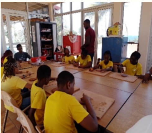
EE BOURG 1 SR Au musée Edgard CLERC, ( LE MOULE)

Après avoir découvert le mode de vie des amérindiens, les élèves sont initiés à la poterie.