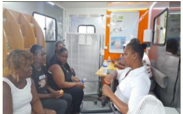
Dans le bus de la Parentalité CAF-UDAF; Les travailleurs sociaux à l'écoute ; «On ti kozé an fanmi »