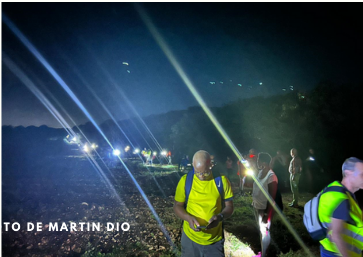
Départ de la randonnée

La rando contée nocturne USEP en famille à Petit-Canal. Une expérience très enrichissante pour tous.