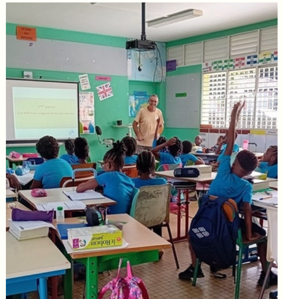
ANIMATION EN CLASSE LA BOUCAN

L'action « Les Oiseaux dans mon environnement » a pour objectif de permettre aux élèves de se familiariser avec leur environnement immédiat en découvrant les oiseaux, leurs habitats, et comment les protéger. Il s'agit par ce moyen de susciter un intérêt sur le long terme pour la protection de la nature.