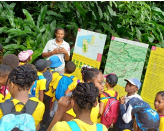
Un agent du Parc National des Forêts de la Guadeloupe explique aux élèves de cycle 3 de l'EE LA BOUCAN, où se situe le parc national, le rôle de la forêt tropicale, et quelles espèces on y trouve .

-La mangrove de Port Louis où les élèves ont pu s'y promener pour observer les palétuviers et y découvrir une partie de la faune.