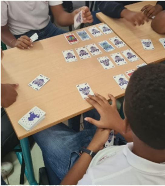
6 QUI PREND REBAPTISÉ « BON APPÉTIT... »

Tous les Lundis, Mardis et jeudis depuis le mois d'Octobre, les élèves du collège Bois Rada s'adonnent durant la pause méridienne aux mathématiques. C'est de manière ludique avec l'atelier « Jeux mathématiques », ou en y intégrant une dimension artistique avec l'atelier « Origami » qu'ils travaillent les compétences de la matière. Calcul mental, comparaison de nombres, repérage dans le plan, raisonnements logiques et stratégiques, géométrie dans l'espace deviennent du divertissement. Le club maths accueille des élèves de tous niveaux qui s'affrontent, s'entraident, s'enrichissent les uns des autres. Au-delà de l'intérêt pédagogique propre à la matière, la dimension humaine est donc une des composantes les plus intéressante avec des élèves qui sans même se connaître vont nouer des affinités le temps d'une partie ou deux.