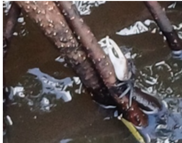
Les racines échasses des palétuviers servent de support aux crabes et autres animaux » explique la maîtresse.