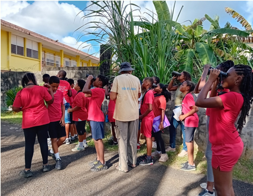
ANIMATION SUR LE TERRAIN BOURG2