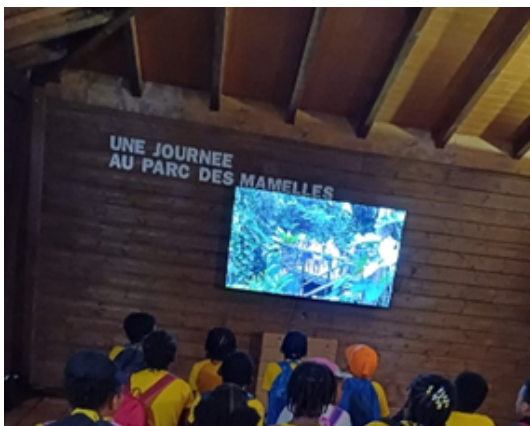
La visite au zoo des mamelles a permis aux élèves de découvrir une partie des espèces qui vivent dans la forêt tropicale.