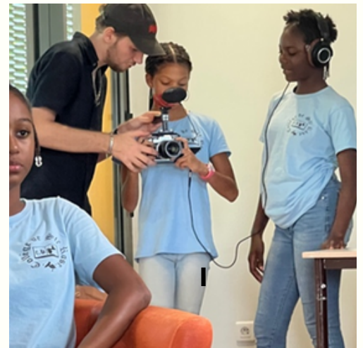
CHACUN À SON POSTE SUR LE PLATEAU!

-Que préfères tu faire dans cette activité? Ce que je préfère, c'est être une journaliste qui interviewe les gens.