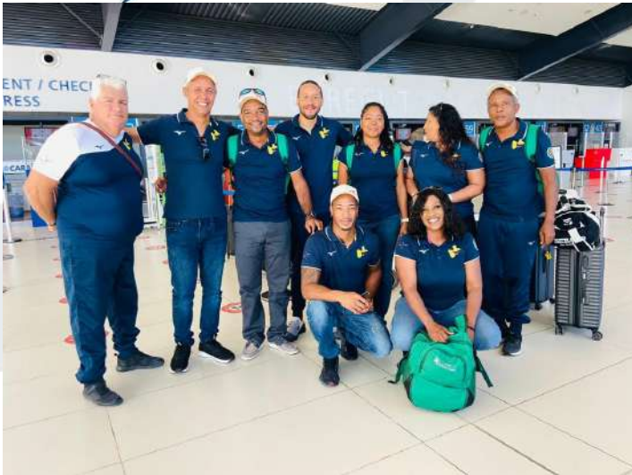
COLOMBIE_départ de la délégation pour les Jeux d'Amérique Centrale et de la Caraïbes : 8 athlètes 8 quotas.