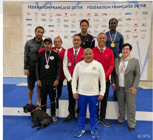
GRAND PRIX DE FRANCE - Arbitres et jeunes Tireurs médaillés Gpe avec la Resp. National de l'Arbitrage