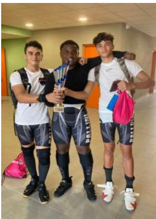
L'équipe du HCPP971 CATEGORIE U17, vainqueur de la Coupe de France des clubs à Clermont l'Hérault le 28/5/2022

Donc on se focalise sur 2 à 3 finales nationales, comme la Coupe de France des Clubs par équipes et le Championnat de France Elite. Rien que ces deux épreuves ont coûté au bas mot 16 005,61€ et la participation FEBECS de 7800€ nous a permis de réaliser ces deux objectifs avec le succès que l'on connaît, le titre de Champion de France par équipes de clubs, et les 5 podiums au Championnat de France Elite.