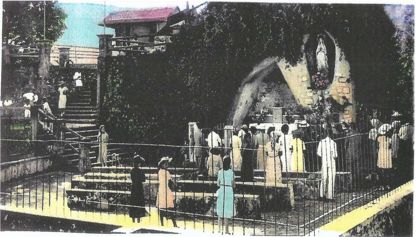
Souvenir de Massabielle, Pointe-à-Pitre, Guadeloupe